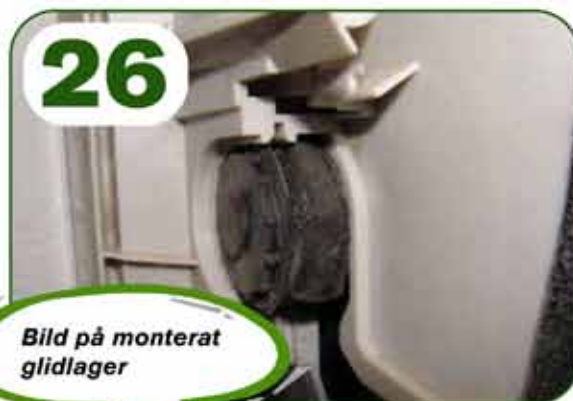
Bild på monterat glidlager