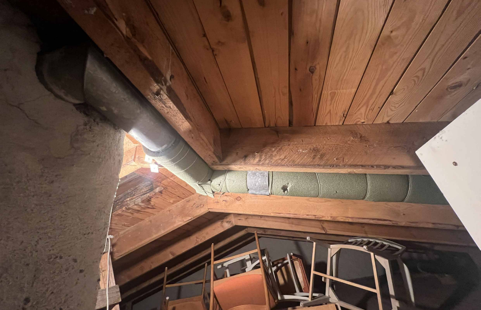
Bild från andra sidan där man ser anslutningen till skorsten