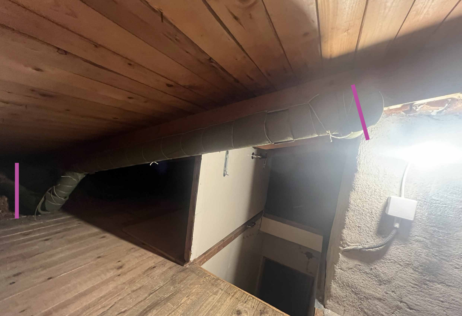
Bild på hela rören vänster i bild är uppgången från toan och höger syns skorsten precis vid lila linjen, Tänkt placering av fläkt där någonstans mellan linjer