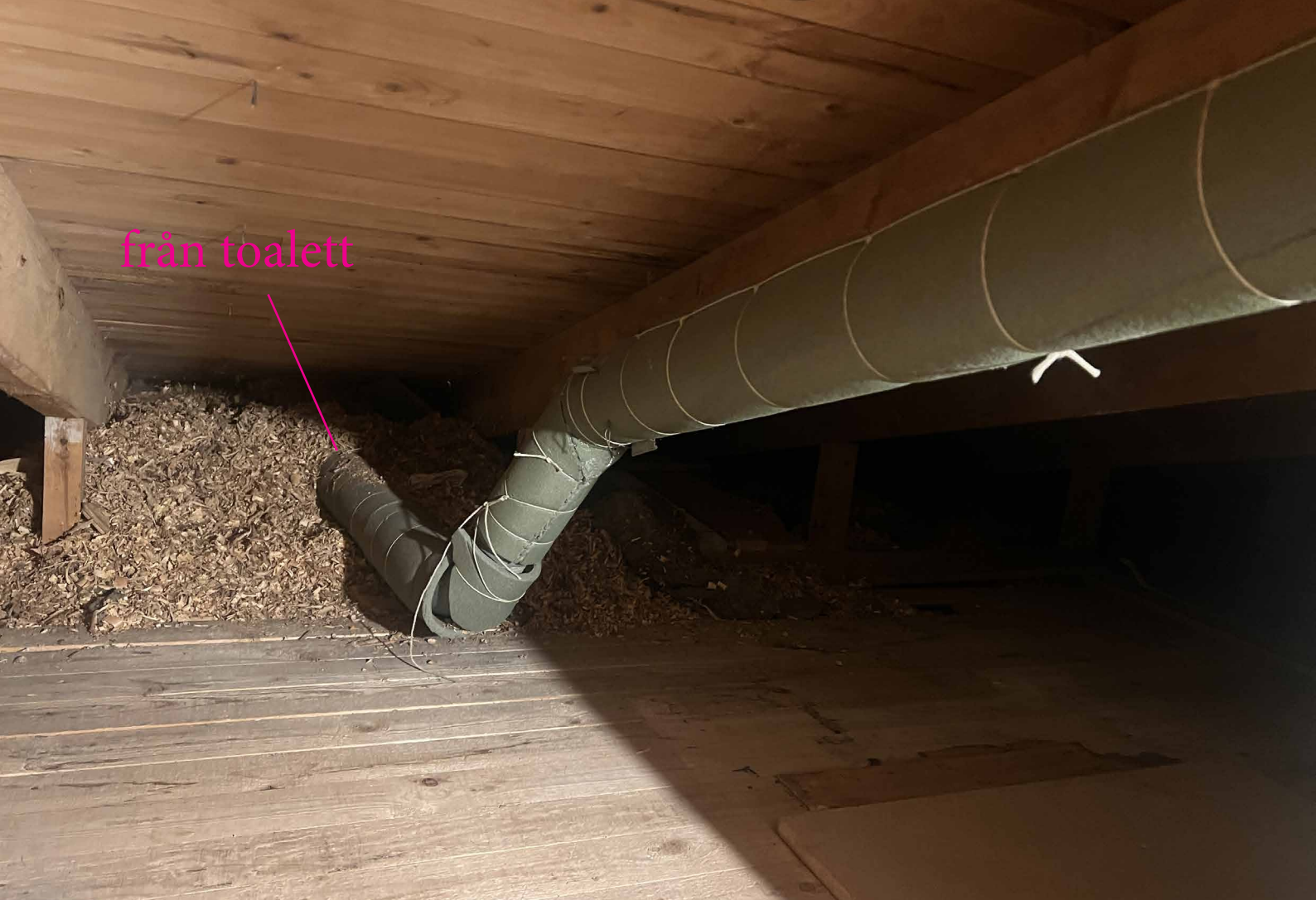
Bild från vind på ppkommande från toalett vind 100mm rör.